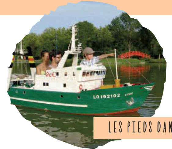
LES PIEDS DANS L'EAU