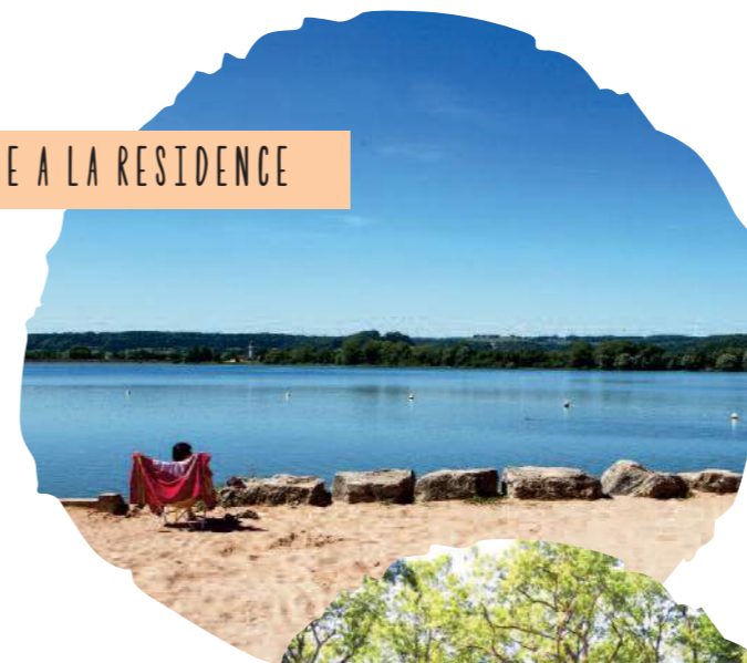
FACE A LA RESIDENCE